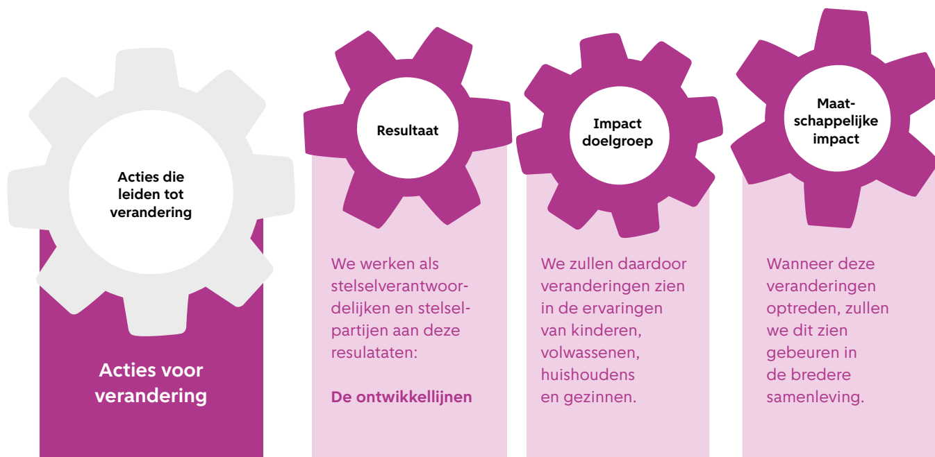
Figuur 1 - werkmodel beoogde transformatie

Wanneer het gaat om het omschrijven van maatschappelijke effecten of impact zijn dat zaken die niet in de directe invloedssfeer van het stelsel of de regioaanpak liggen. Wel geven ze onze ambitie weer op samenlevingsniveau en vormen daarmee onze stip op de horizon. Aan die stip zijn resultaten te verbinden waarop we als betrokken stelselpartijen en stelselverantwoordelijken samen met de kennis van ervaringsdeskundigen wel invloed hebben. Ieder half jaar bepalen we gezamenlijk aan welke acties te werken om 'dichterbij' die resultaten te komen. Dat kan betekenen dat we afbreken wat een barrière vormt, we meer aandacht geven aan dat wat kansrijk is en hetgeen geleerd is een plek geven in het licht van de beoogde transformatie.